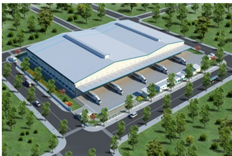
Khu kho Bình Điền (2016)